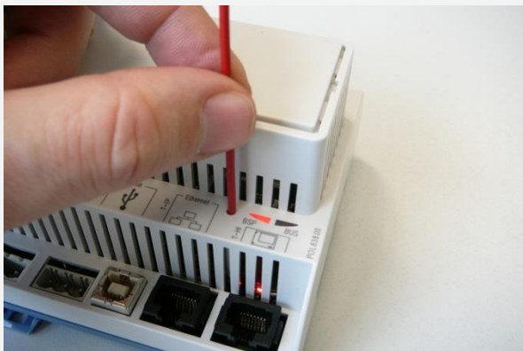
Stisknutí servisního tlačítka